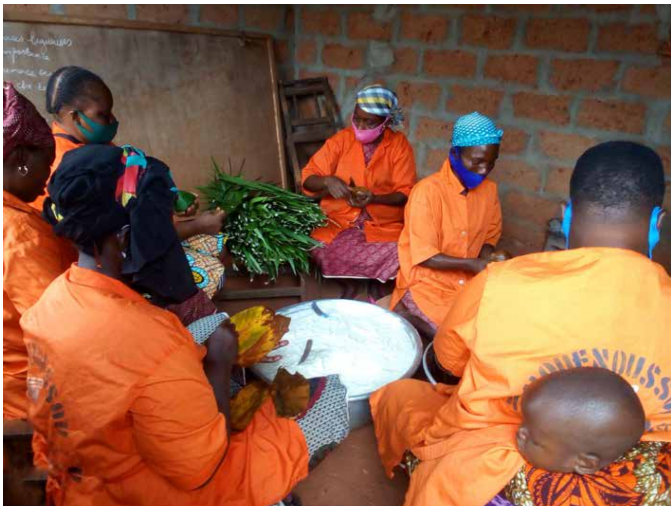
L'étape d'emballage du lio se déroule dans un travail à la chaîne.

il faut vanner, trier, laver et tremper le maïs dans de l'eau chaude. Le lendemain, le maïs trempé est retiré de l'eau et moulu. Mélangé à l'eau, cette solution épaisse est filtrée ; ce qui permet de séparer l'amidon du son du maïs. L'amidon reste au repos durant une journée et porté au feu pour la préparation du « Akpan ». A demi-cuisson, cette pâte est déversée dans une grande bassine pour être emballée en boule et attachée avec des feuilles de palme pour le maintien de la boule.