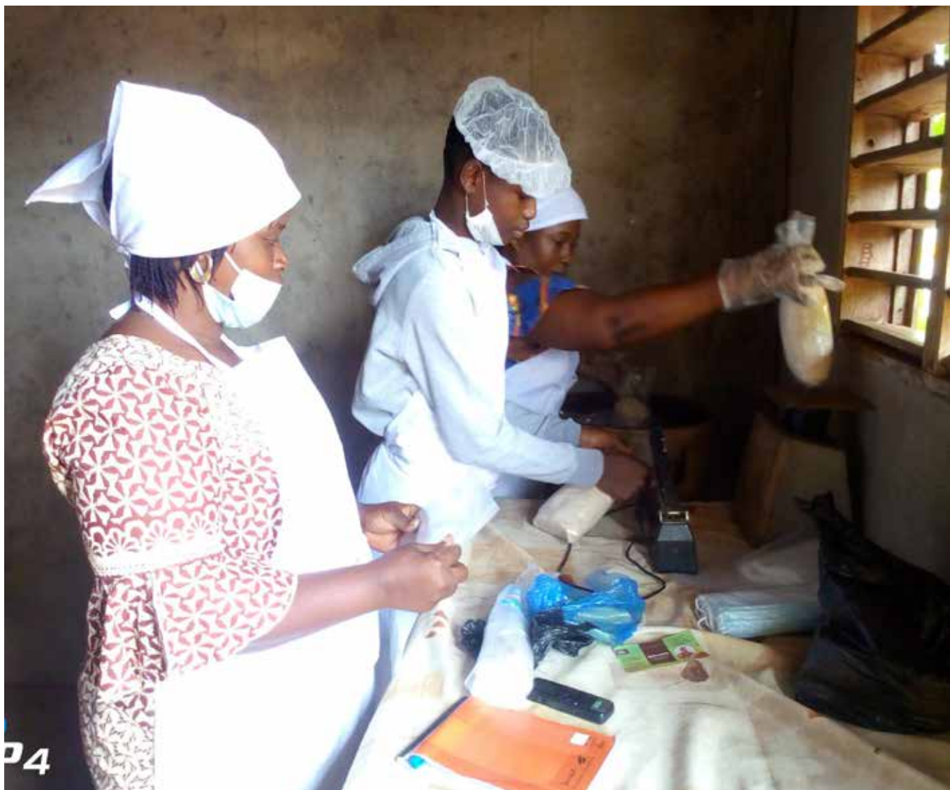
La mise en sachet de la farine Sofomorin

céréale est torréfiée et refroidie. A la dernière étape, tout le mélange avec les arômes passe au moulin pour l'obtention de la farine.