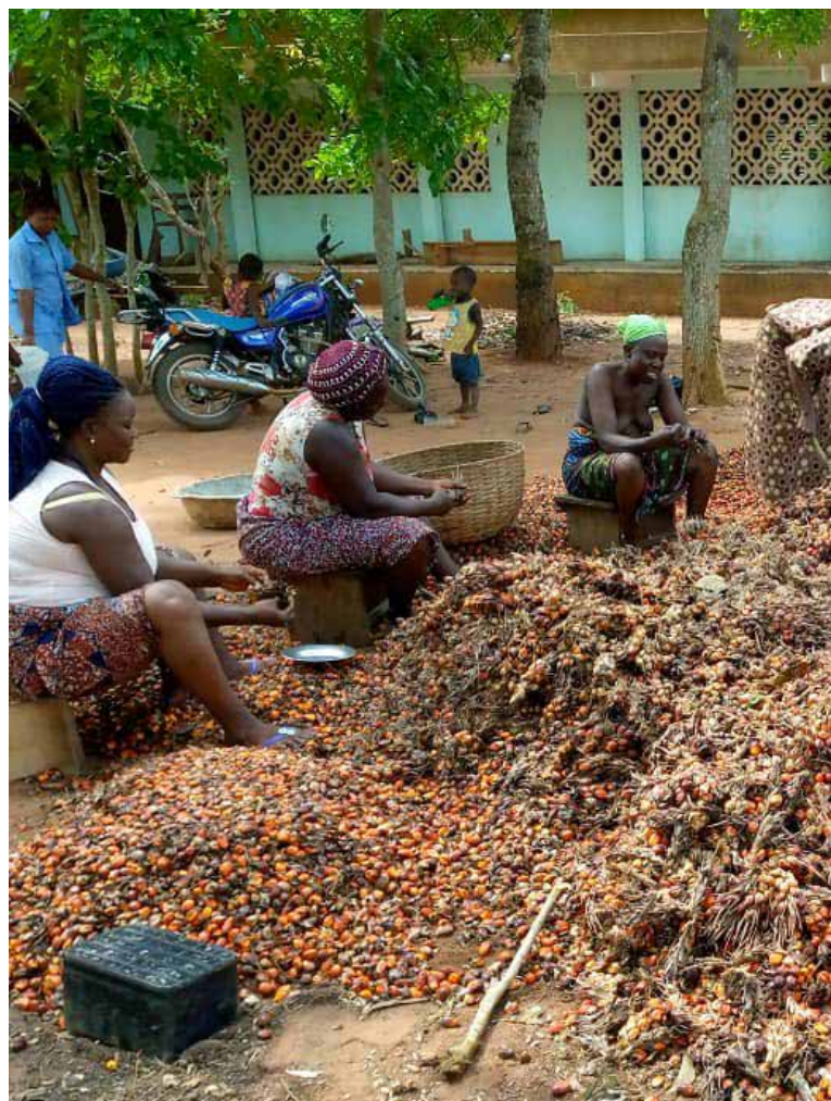
La préparation de l'huile de palme suit un processus