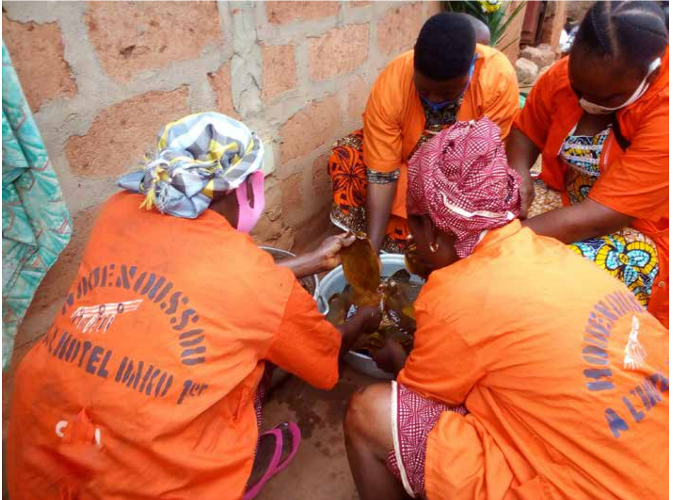
Quelques femmes du Groupement Houénoussou de Bohicon s'activent autour de la préparation du Lio

B ouée de sauvetage des femmes dans les milieux ruraux, l'économie politique des groupements féminins accorde revenus et subsistance à celles qui s'y consacrent. Dotées d'une forte capacité d'adaptation, les femmes se retrouvent sur tout le circuit de la production agricole et de la chaîne de la valeur ajoutée à savoir : le défrichage, le labour, le semis, le sarclage, la récolte, la transformation, la commercialisation et la consommation. Elles passent ainsi aisément de la fourche à la fourchette, c'est-à-dire de la houe au fourneau puis à l'assiette.