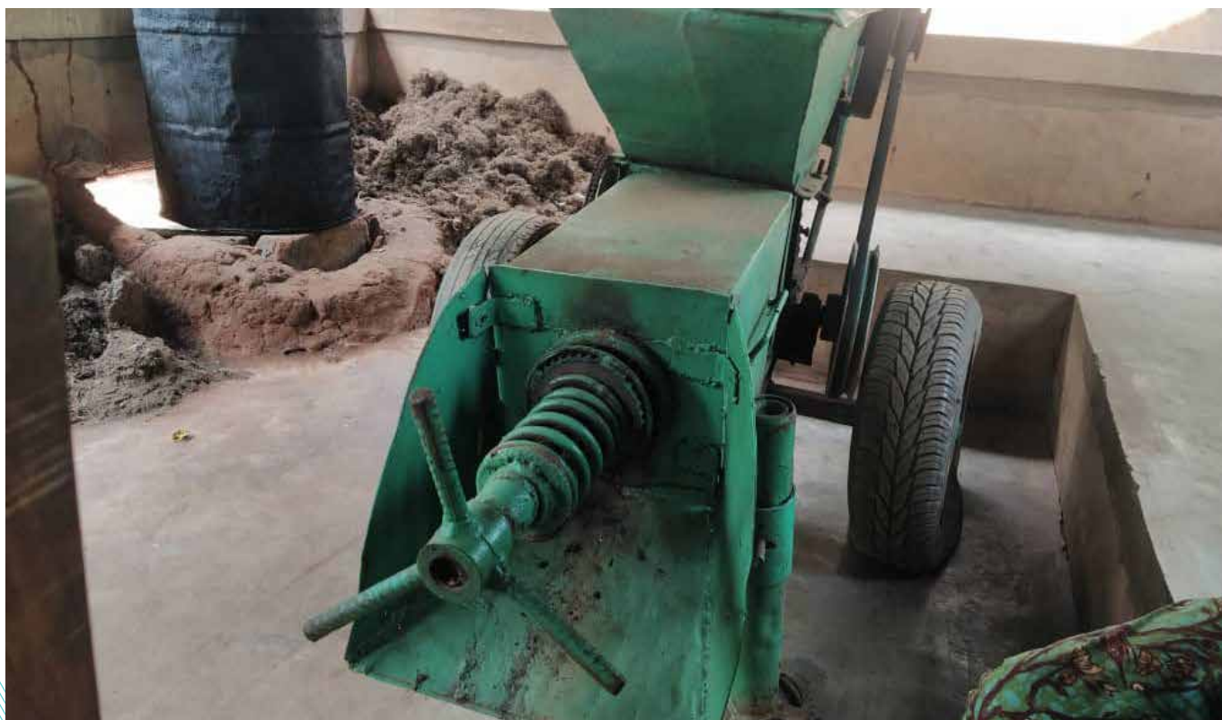
La méthode utilisée ici est archaïque

Les groupements d'intérêt économique (GIE) agricoles féminins se veulent être la panacée pour leurs membres assoiffés de développement en milieu rural. A la fois productrices, transformatrices et commerçantes, elles s'illustrent par leur savoir-faire au sein de ces creusets pour satisfaire les besoins en matière de sécurité alimentaire. Ce défi, elles le relèvent dans la plupart des cas, au prix de rudes sacrifices, faute d'accompagnement adéquat pour soutenir leurs efforts. Mais, en dépit de tout, ces femmes sont persuadées que ces pages difficiles pourront être tournées si l'engagement des partenaires au développement et des pouvoirs publics ne faiblit pas.