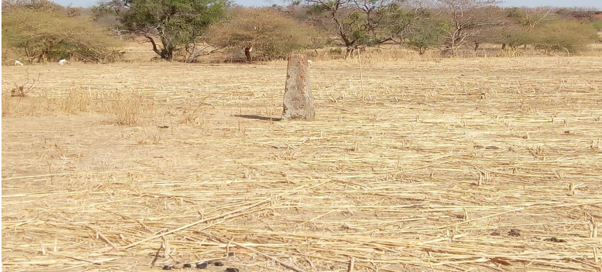
Image 1 : Piste à bétail occupée par un champ dans la commune rurale de Partiaga dans la province de la Tapoa.

rapport à l'Est s'explique par la rareté des pluies au Sahel qui fait que la zone est moins occupée par les producteurs agricoles, laissant assez d'espace pour les activités pastorales et limitant en même temps les éventuels conflits entre exploitants des ressources naturelles.