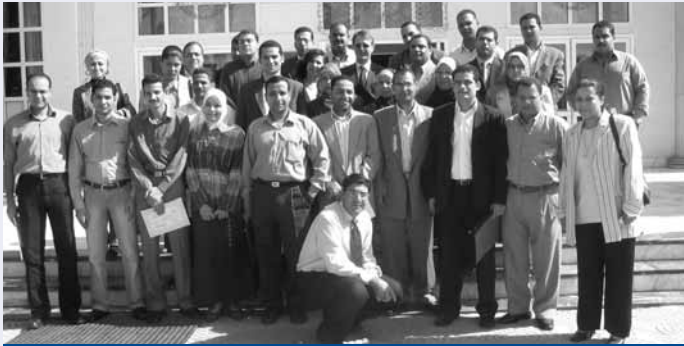
Teilnehmer des Workshops