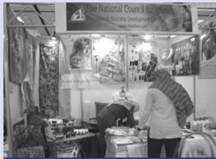
Produktmesse am Rande des Global Summit

عقدت في يونيو ٢٠٠٦ ورشة العمل الإعدادية الثالثة والأخيرة لمؤتمر "قمة المرأة العالمية" حيث قام مركز تنمية سيدات الأعمال التابع للمجلس القومي للمرأة المصري في إطار ورشة العمل بمناقشة مختلف الموضوعات المدرجة على جدول أعمال القمة لتمكين سيدات الأعمال المصريات من المشاركة الفعالة في المؤتمر.