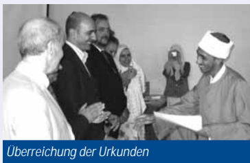
Überreichung der Urkunden

الأكاديمية الصيفية ٢٠٠٦ بدأ في ٢٥ يونيو ٢٠٠٦ "برنامج حوار الحضارات" بجامعة القاهرة باعتباره محور الأكاديمية الصيفية لهذا العام والتي تستمر على مدى أربعة أسابيع وتتناول موضوع التنمية المستدامة. وخلال الفترة الكاملة للدورة الصيفية قام المشاركون في إطار محاضرات ومجموعات عمل وبحوث ميدانية بمناقشة مختلف جوانب التنمية المستدامة.