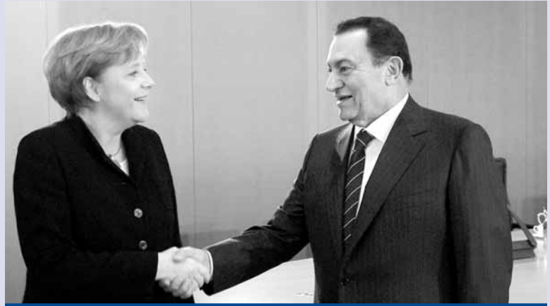
Bundeskanzlerin Dr. Angela Merkel mit dem ägyptischen Präsidenten Hosni Mubarak bei dessen Besuch in Deutschland Anfang des Jahres 2006.