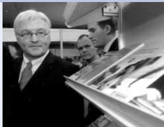
Außenminister Dr. Frank-Walter Steinmeier am deutschen Stand der Kairoer Buchmesse وزير الخارجية الألماني د. فرانك فالتر شتاينمايار في الجناح الألماني بمعرض القاهرة الدولي للكتاب

Wir sind dankbar dafür, dass wir gemeinsam mit unseren ägyptischen Partnern eine ganze Reihe interessanter Projekte erfolgreich zu Ende führen und auf diese Weise zum allgemeinen Entwicklungs- wie zum politischen Demokratisierungsprozess Ägyptens beitragen konnten.