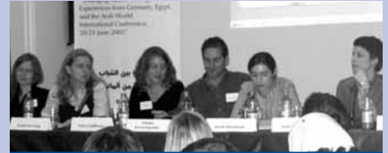
Deutsche Studenten präsentieren ihre Feldforschungsergebnisse