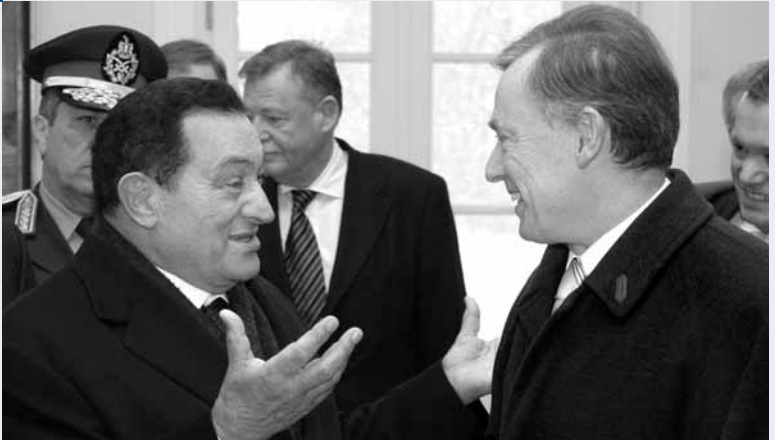
Bundespräsident Prof. Dr. Horst Köhler empfängt den ägyptischen Präsidenten Hosni Mubarak in Berlin während dessen Besuches in Deutschland im März 2006.

نحن نشعر بالفخر والعرفان لما تم إنجازه في إطار التعاون والعمل المشترك مع شركائنا المصريين من خلال تنفيذ مجموعة من المشروعات الهامة الناجحة التي قدمت بصفة عامة مساهمة للعملية التنموية ولزيادة الديمقراطية السياسية في مصر.