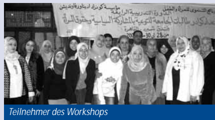
Teilnehmer des Workshops

كان موضوع "الشباب وتغير القيم - خبرات من ألمانيا ومصر والشرق الأوسط" محوراً لمؤتمر عقد بالتعاون مع معهد جوته ومركز الشرق الحديث في برلين وذلك في يونيو ٢٠٠٥ بالقاهرة حيث التقى خبراء مصريون على سبيل المثال وزير الشباب السابق أ. د. علي الدين هلال مع الخبراء الأجانب وكان من بينهم الخبير الألماني أ. د. ريشارد مونشهايمر (كاتب دراسات الشباب التي مولتها شركة شل) وذلك لمناقشة مسائل خاصة بتغير القيم لدى الشباب.