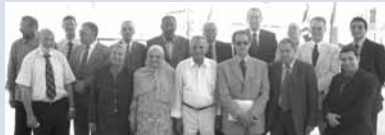
Teilnehmer des Workshops

عقد "برنامج الدراسات البرلمانية" بجامعة القاهرة ورشة عمل فى بورسعيد استمرت للعديد من الأيام وجاءت كاستمرار لسلسلة ورش عمل للبرلمانيين المصريين؛ وقد مثلت لهم هذه الورشة فرصة لمناقشة الخبراء فى مختلف الموضوعات السياسية الجارية.