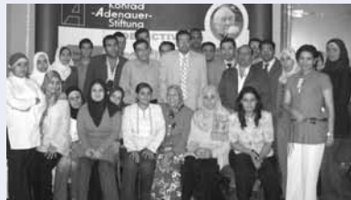
Teilnehmer des Workshops

وكانت تهدف ورشة العمل الثانية المقامة في سبتمبر ٢٠٠٦ في القاهرة بالتعاون مع الجمعية المصرية لنشر وتنمية الوعي القانوني مساعدة الصحفيين على التعرف على وظائف وطريقة عمل البرلمان المصري والذي من شأنه تحسين أداء الصحفيين في إعداد التقارير عن ذلك المجال السياسي الهام.