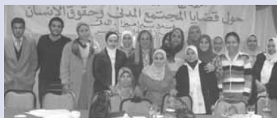
Teilnehmer des Workshops

بعد نجاح الندوة التي حملت عنوان "المرأة والإعلام" واصل البرنامج التنموي للمرأة والطفل العمل في هذا المحور وقامت بتنظيم ورشة عمل استمرت لعدة أيام في فبراير ٢٠٠٦ للتعريف السياسي لشباب الصحفيين. وقد تم تعريف المشاركين بكيفية تكثيف المشاركة السياسية في إطار المجتمع المدني المصري.