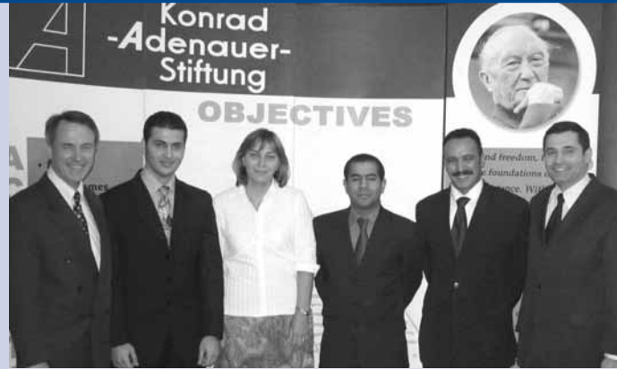
Das KAS Team in Kairo