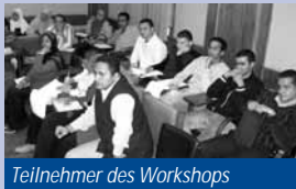
Teilnehmer des Workshops

Ziel dieses im Dezember 2005 in Zusammenarbeit mit dem „Center for Political Research and Studies“ (CPRS) durchgeführten viertägigen Workshops war es, die Dialogfähigkeit von Vertretern ägyptischer NRO zu stärken und damit einen Beitrag zur besseren Zielerreichung dieser Organisationen zu leisten.