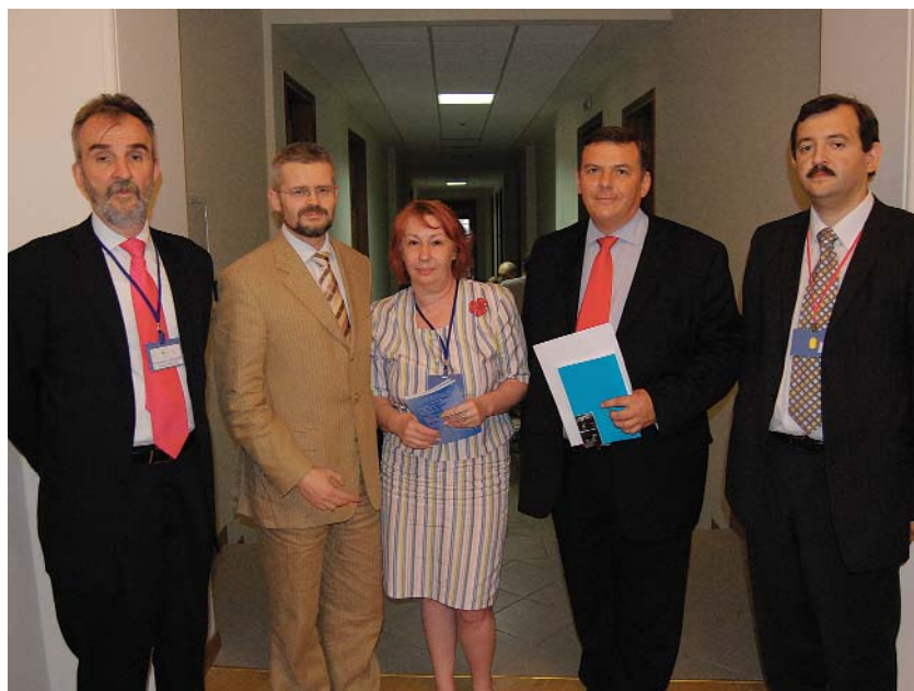
Євроатлантичне майбутнє України + Міжнародний форум