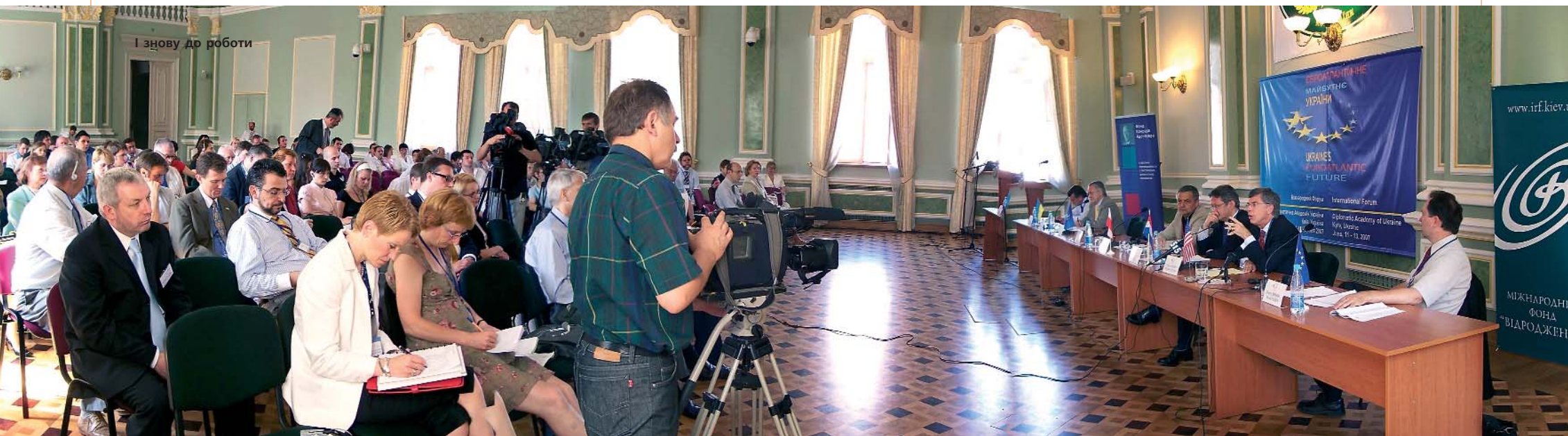
Дискусія Ю. Єханурова з учасниками форуму