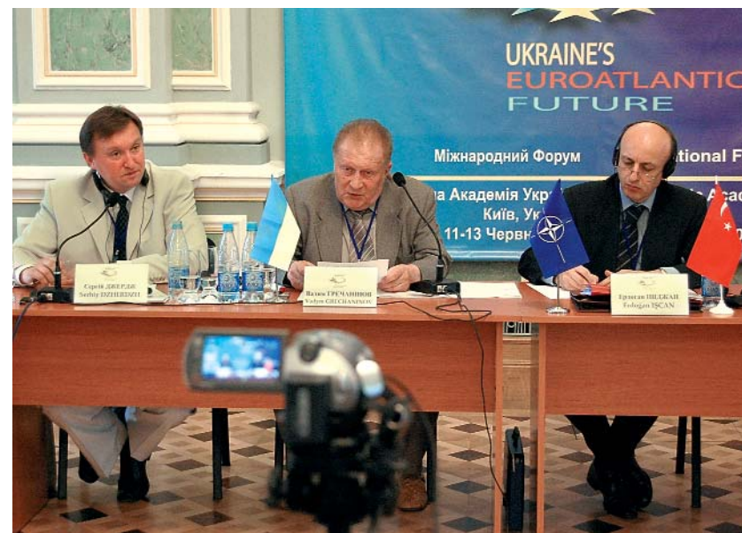
Дипломатична Академія України + Київ + Україна + 11 - 13 червня 2007