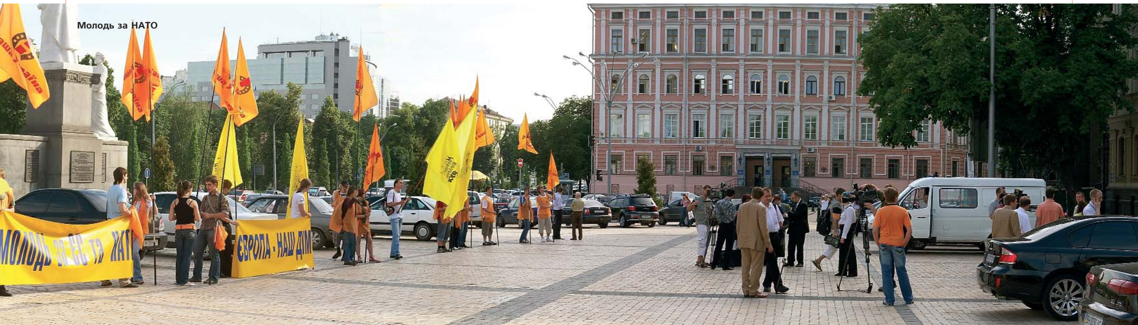
Молодь за НАТО