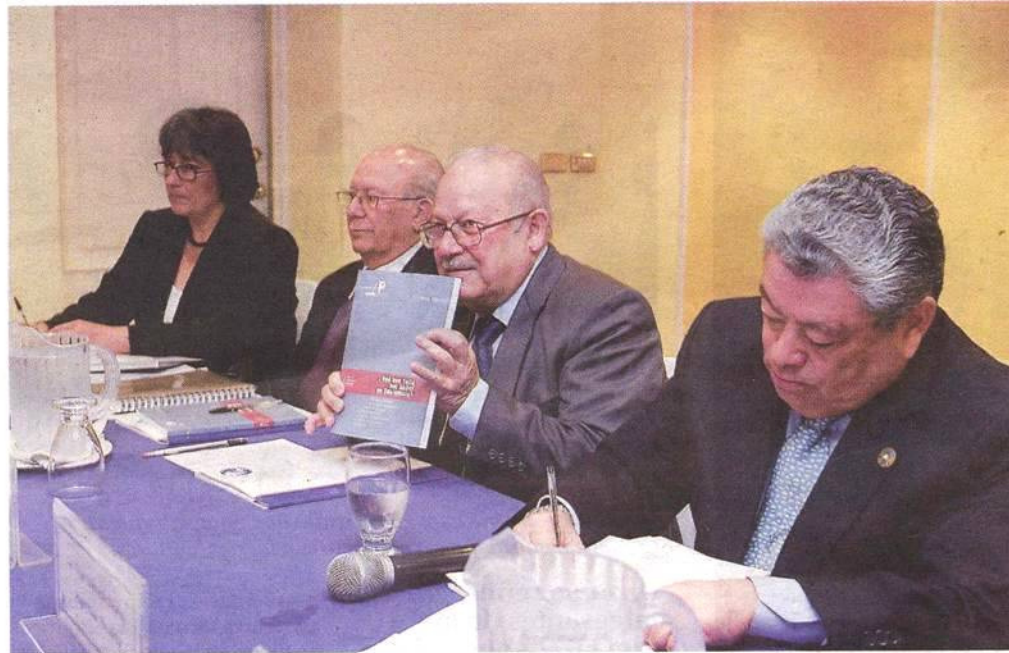
ATAREADOS. Los magistrados estudiaron los casos de países vecinos y experiencias de sus colegas.

En la primera vuelta electoral, Álvaro Colom, de la Unidad Nacional de la Esperanza, superó a Otto Pérez, del Partido Patriota,