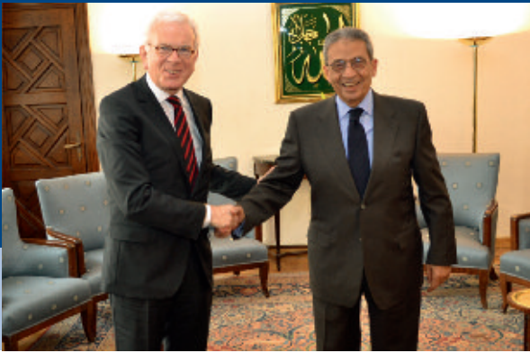
En El Cairo el eurodiputado Dr. Hans-Gert Pöttering conversó con el secretario general en funciones de la Liga Árabe y candidato presidencial Amr Moussa.