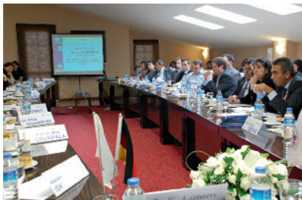
En un taller de la KAS en Ankara cerca de 50 expertos de Turquía y Armenia además de observadores internacionales discutieron sobre el estado actual y las perspectivas de las relaciones turco-armenias y sus implicaciones en la región.

El 2 de diciembre de 2010 la oficina de la KAS en Ankara, en cooperación con la Organización para la Investigación Internacional Estratégica (USAK), llevó a cabo el taller de expertos "The Turkish-Armenian Relations: One Year After the Protocols".