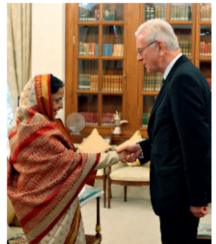
El eurodiputado Dr. Hans-Gert Pöttering conversando con la presidenta de Estado de la República de India Pratibha Patil.

Adicionalmente el presidente de la KAS se reunió con la presidenta india de Estado, Pratibha Patil, la presidenta del parlamento indio (Speaker of the Lok Sabha), la Dra. Meira Kumar, el ministro de estado de Defensa, Pallam Raju, y con Shiv Shankar Menon, asesor nacional de seguridad (National Security Advisor) del gobierno indio.