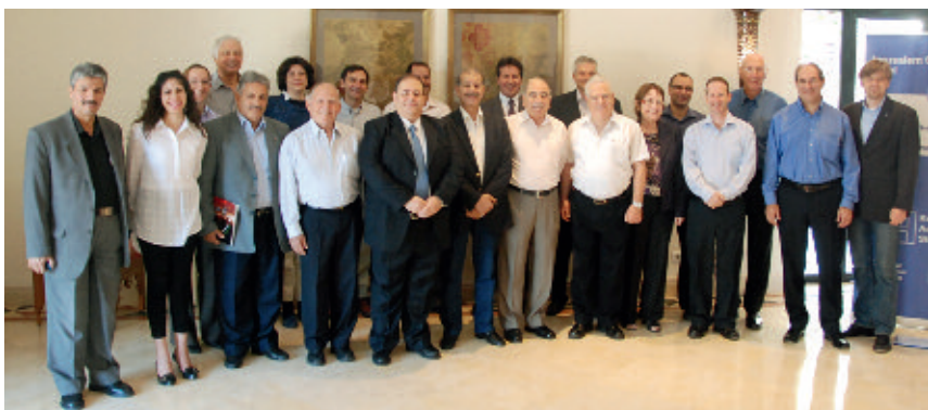
Participantes del taller.

nia no es posible una cooperación específica. A pesar de ello, en el taller surgió la propuesta de iniciar con la planeación de proyectos pequeños para lograr realizarlos cuando la situación política lo permita.