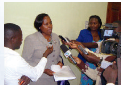
En el marco del evento de diálogo la ministra ugandesa de información Kabakumba Masiko enfrentó las preguntas críticas de la prensa presente.

En una declaración conjunta periodistas ugandeses y defensores de derechos humanos expresaron su preocupación por el estado de los derechos humanos y de la libertad de prensa en Uganda. En diciembre de 2010 formularon recomendaciones y demandas dirigidas al ámbito político y al sector de los medios. La declaración se elaboró durante un taller sobre el tema "Periodistas como portadores y promotores de derechos humanos", realizado por la KAS en cooperación con la organización contraparte ugandesa UMDf y apoyado por la GIZ. En el contexto de un evento de diálogo sobre el mismo tema se presentó la declaración con la presencia de la ministra ugandesa de Información. Adicionalmente al exhorto dirigido al gobierno, al parlamento y a la justicia por un mayor respeto de la libertad e independencia de los medios, la declaración recomienda importantes estrategias para mejorar los estándares profesionales y éticos en Uganda.