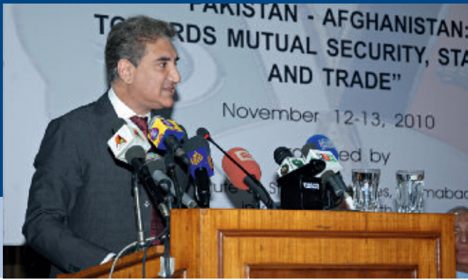
El ministro pakistaní de Relaciones Exteriores Shah Mahmood Qureshi en su discurso inaugural de la conferencia bilateral.