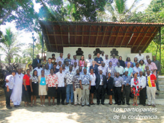
Los participantes de la conferencia.