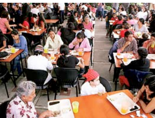
LOS COMEDORES ofrecen dos raciones al día a un precio simbólico.