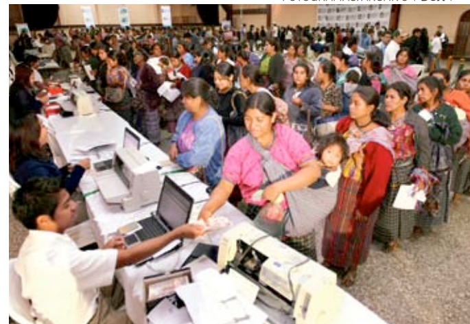
EL PROGRAMA de transferencias es el que provoca mayores críticas por la concentración de recursos, pero el que muestra más resultados.