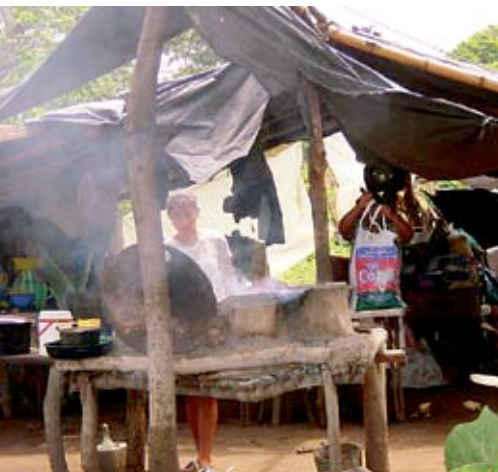
LA MOVILIDAD SOCIAL se producirá en 10 o 15 años como efecto de los programas.