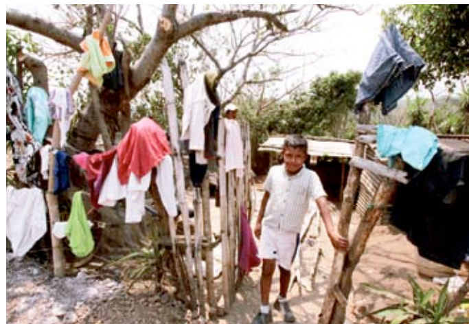
HABLAR DE POBREZA y marginación para algunos sectores tiene que ver con el pasado y limita el tema de riqueza y prosperidad.