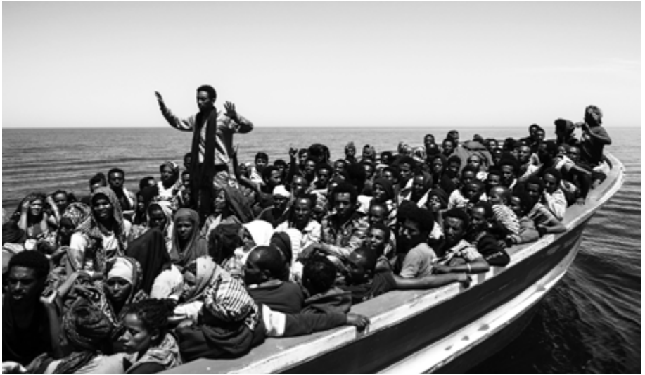
Auf dem Weg nach Europa: Angesichts der steigenden Zahlen von Flüchtlingen ist ein Umdenken in Politik und Gesellschaft nötig.

schwer fallen, und es wird zu Spannungen in unseren Gesellschaften, in unseren politischen Systemen führen.