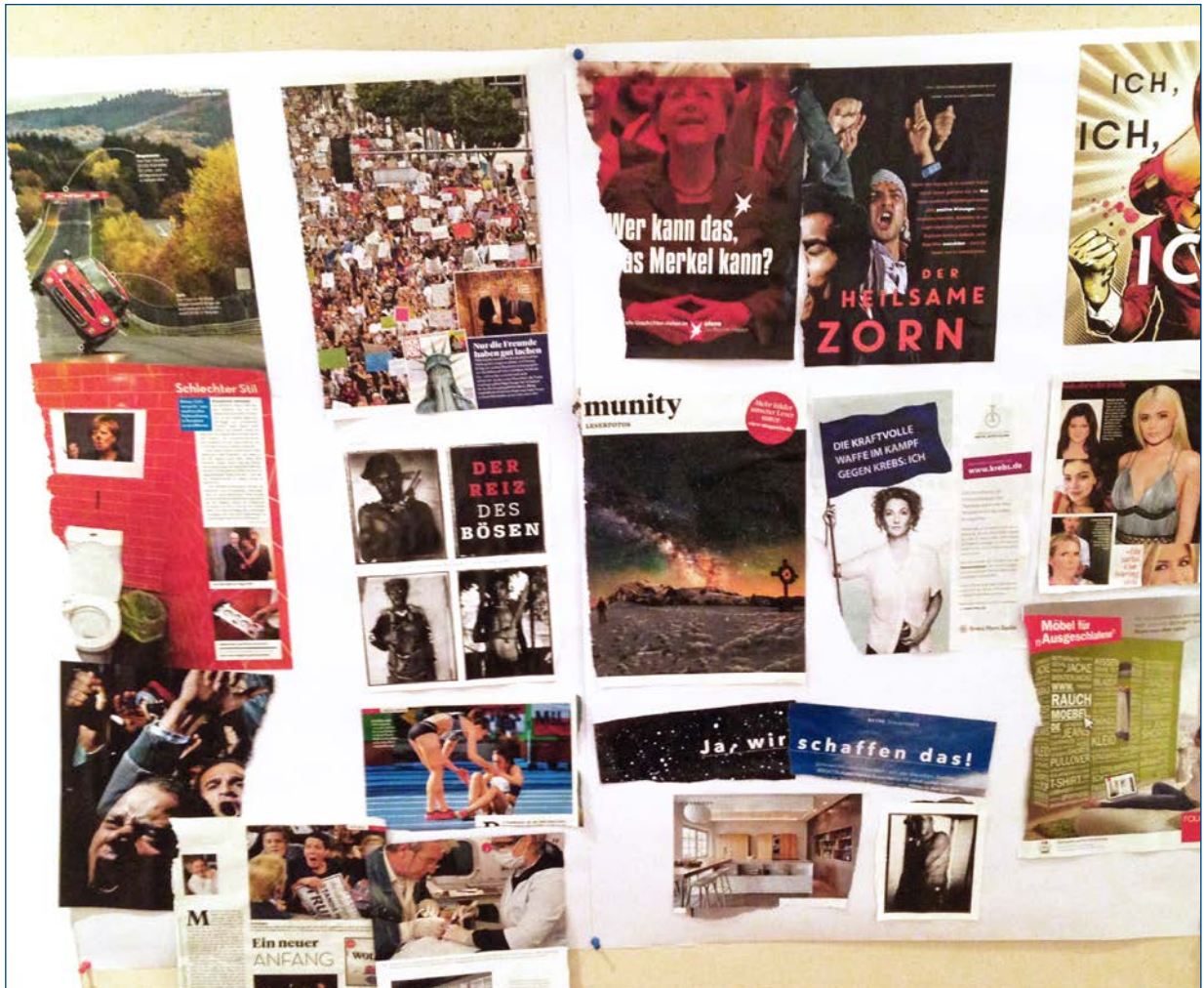
Abbildung 2: Essen am 9.12.2016.