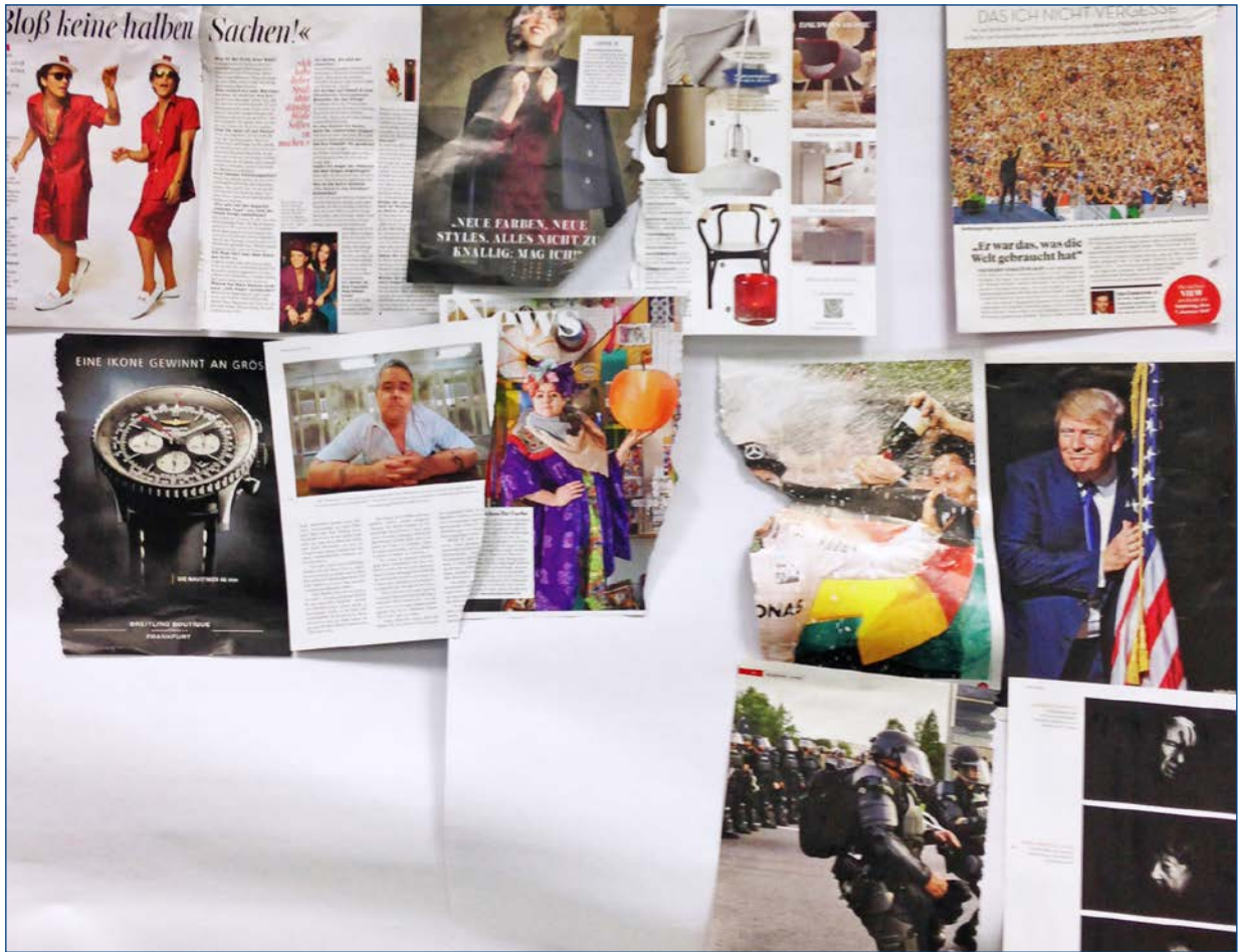
Abbildung 4: Dresden am 7.12.2016.