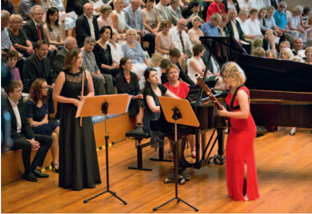
Stipendiatinnen der Konrad-Adenauer-Stiftung umrahmen das Programm der Preisverleihung musikalisch.