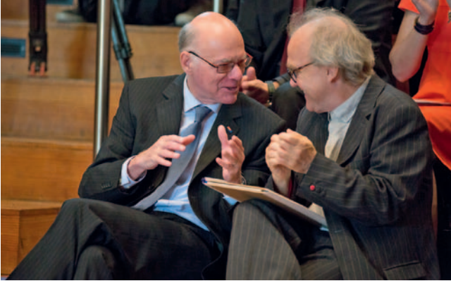
Prof. Dr. Norbert Lammert im Gespräch mit Michael Köhlmeier.