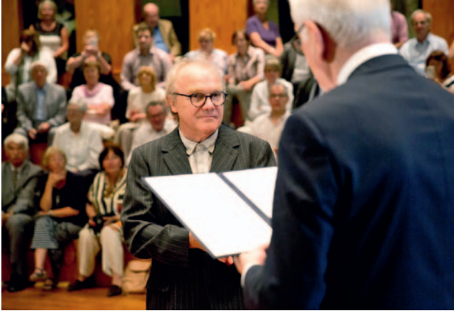
Dr. Hans-Gert Pöttering verliest den Urkundentext.