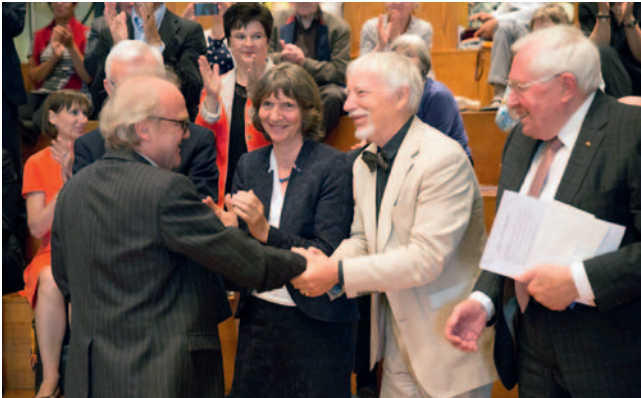
Michael Köhlmeier bedankt sich bei seiner Laudatorin und deren Ehemann.