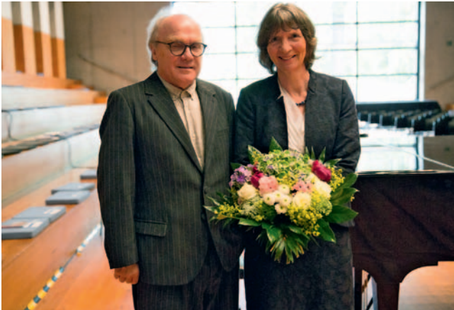
Michael Köhlmeier und Prof. Dr. Aleida Assmann.