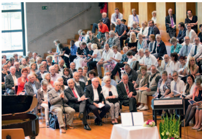
Blicke in den Saal.