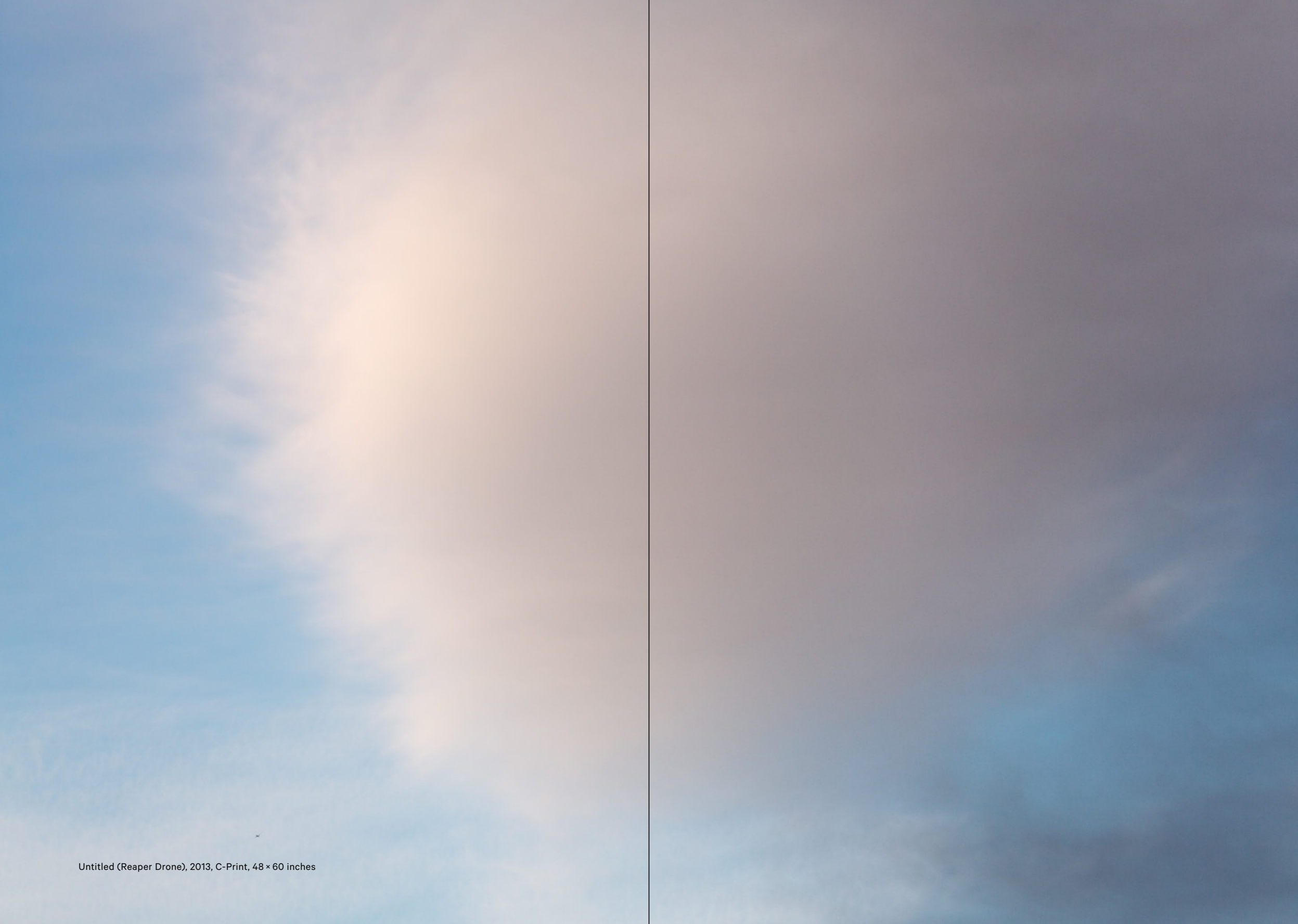
Untitled (Reaper Drone), 2013, C-Print, 48 × 60 inches