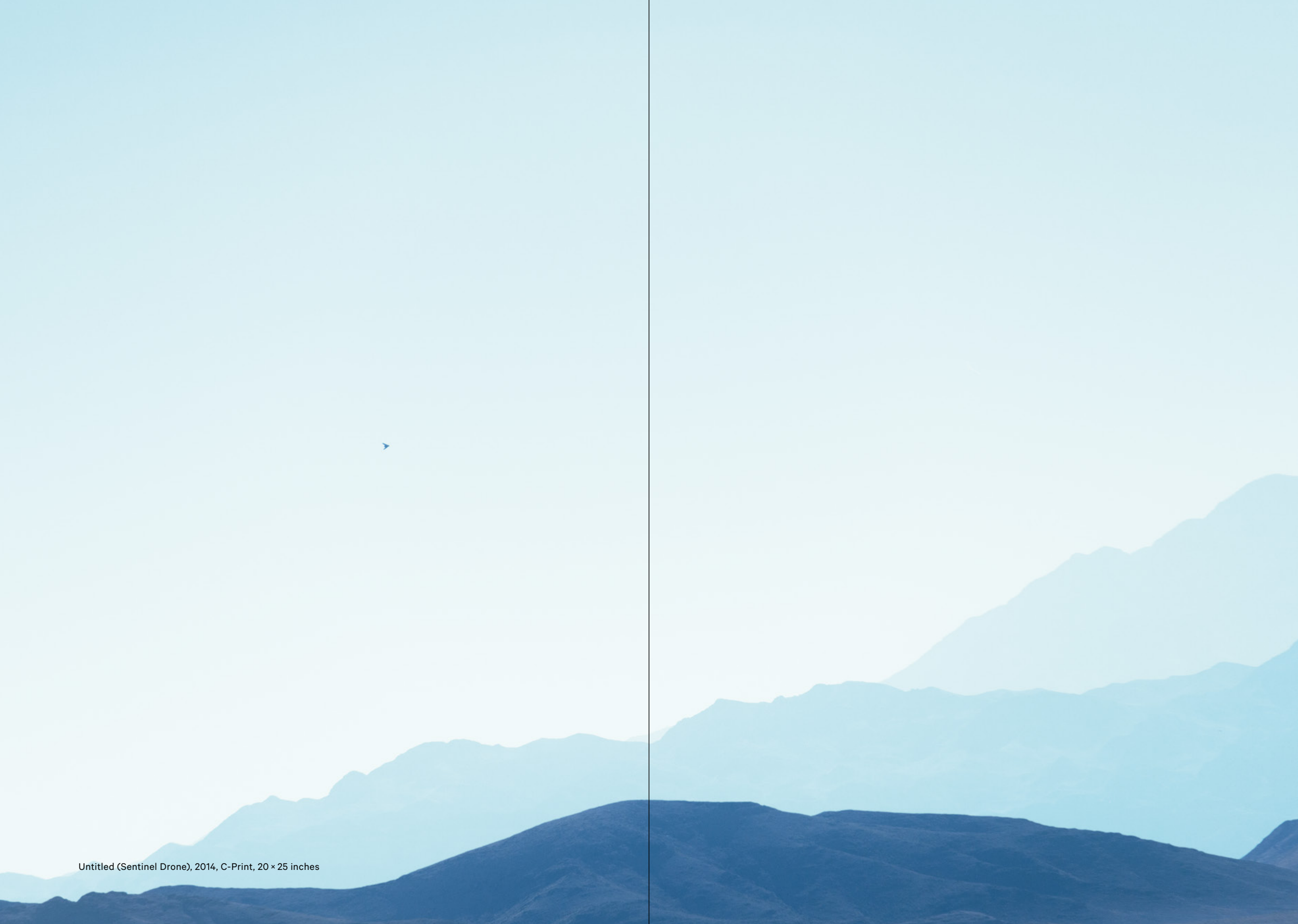
Untitled (Sentinel Drone), 2014, C-Print, 20 × 25 inches