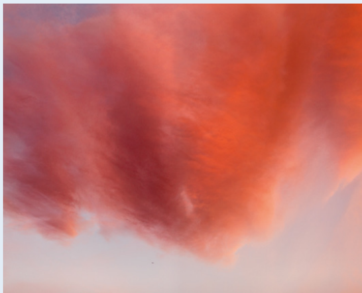
Untitled (Reaper Drone), 2015, Pigment print, 48 × 60 inches