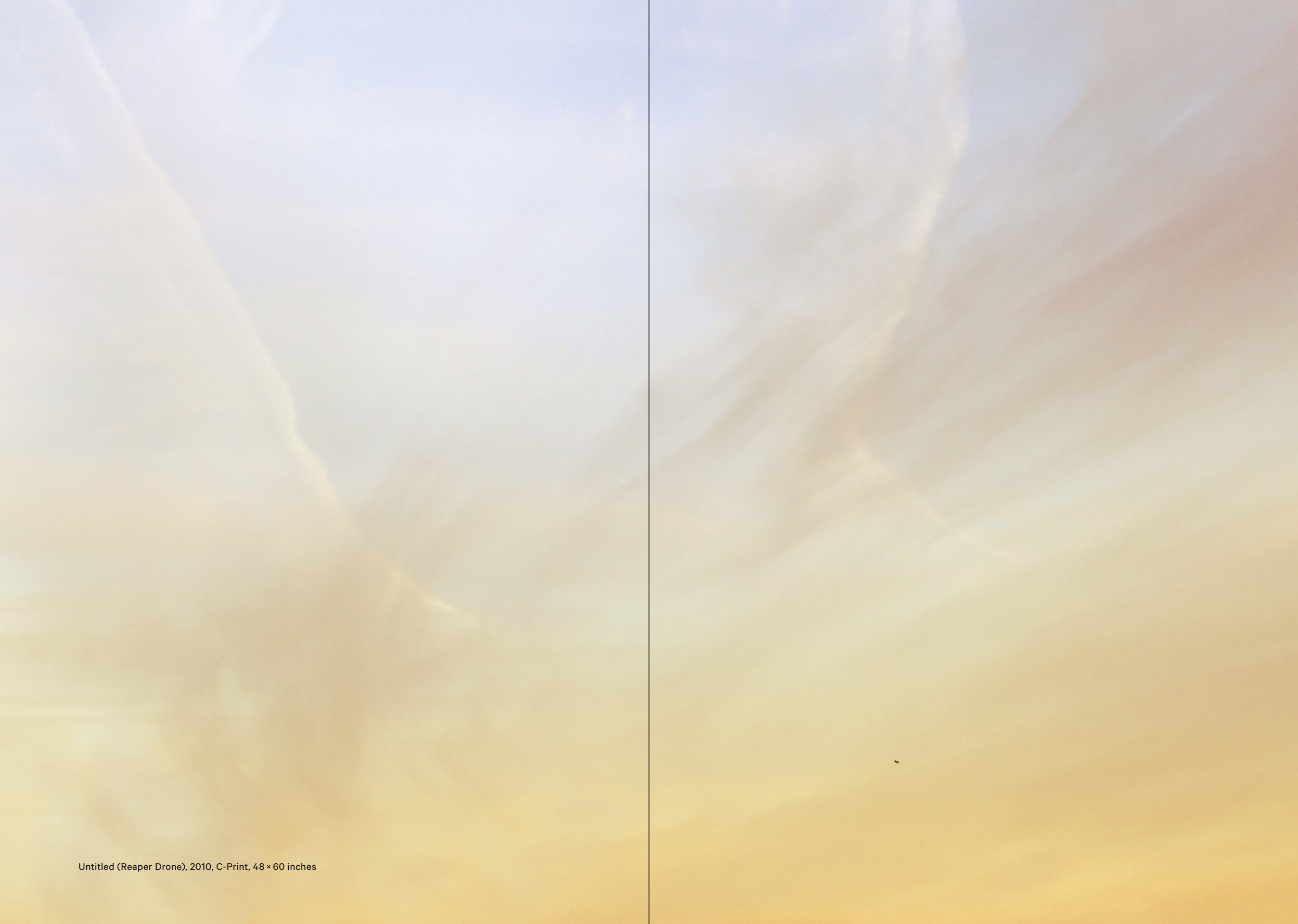
Untitled (Reaper Drone), 2010, C-Print, 48 × 60 inches