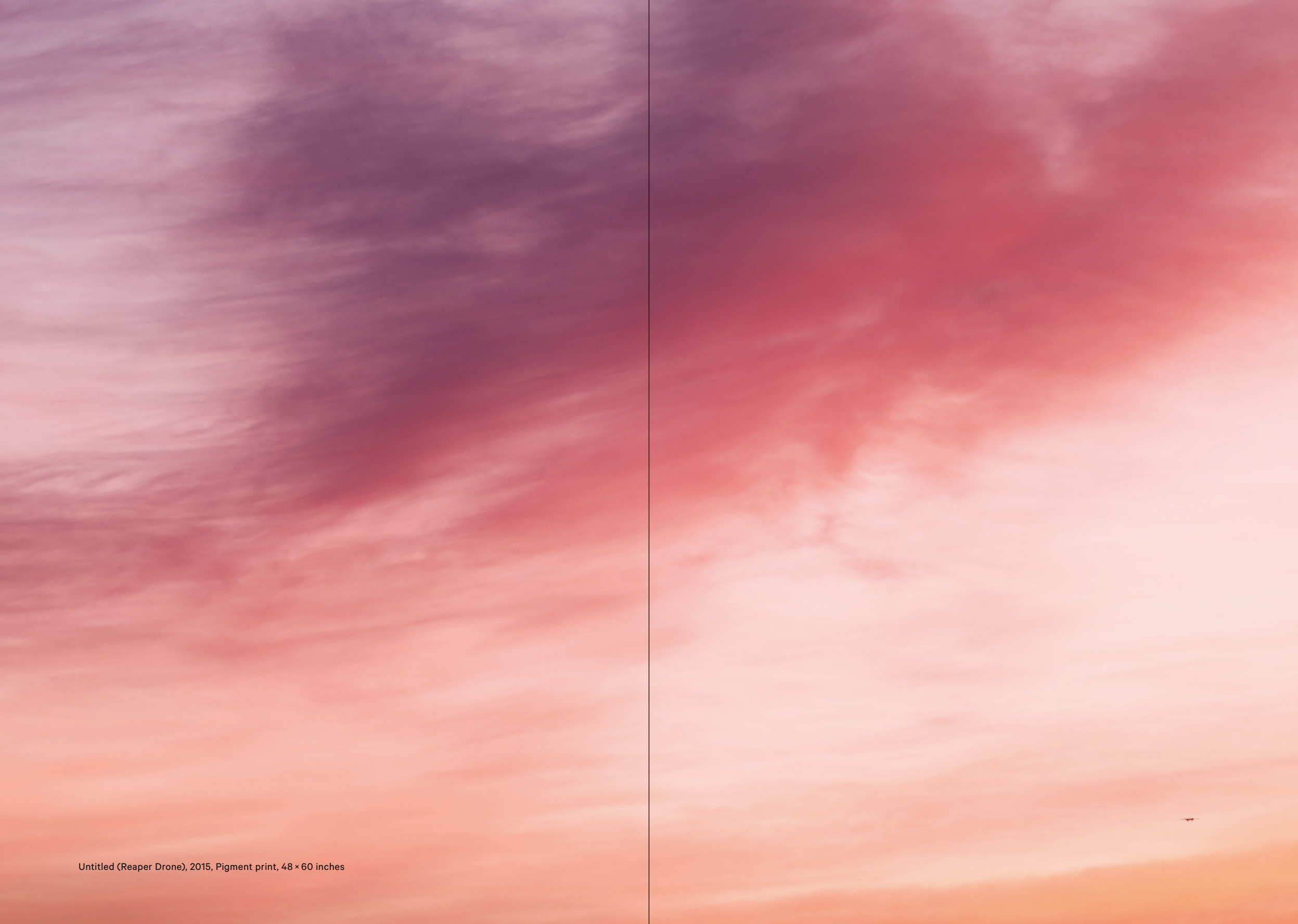
Untitled (Reaper Drone), 2015, Pigment print, 48 × 60 inches