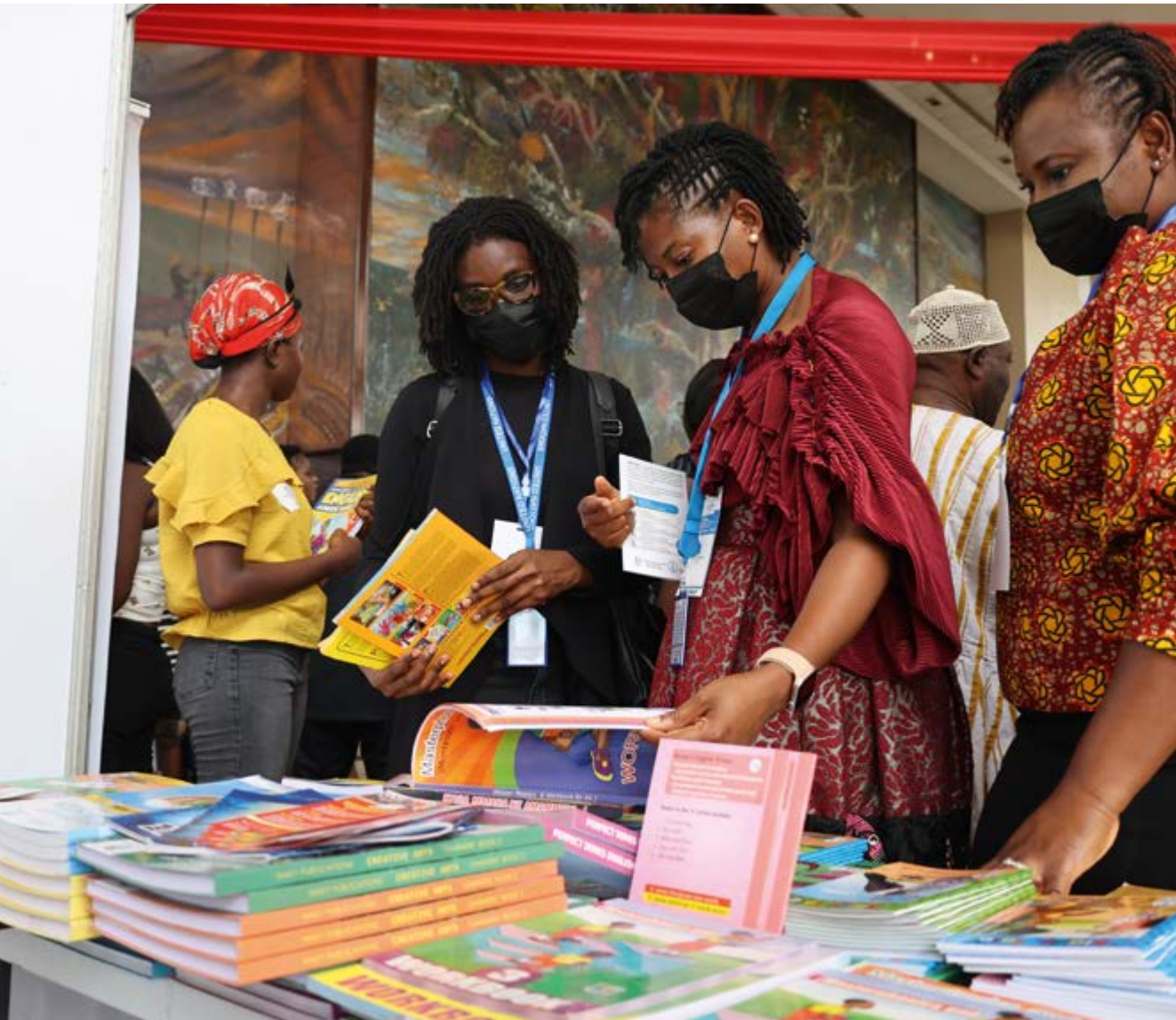
Gegen die Krisenerzählung: Nach wie vor wird Afrika im hiesigen Diskurs vielfach mit Armut und Elend assoziiert – dabei entwickeln sich viele Länder positiv und bringen zunehmend eine gut ausgebildete Mittelschicht hervor.

Ursachensuche geraten zwei Dinge in den Blick: zum einen das Zusammenspiel mit anderen Politik- und Themenfeldern (etwa die Bedingungen im Welthandel) und zum anderen die Liste der unerwünschten (Neben-)Effekte fehlgeleiteter Ansätze. Vor dem Hintergrund der hohen Aufwendungen steht die EZ auch innenpolitisch unter Rechtfertigungsdruck. Doch das Absprechen ihrer Daseinsberechtigung ist letztlich ignorant und verkennt die Realitäten globaler