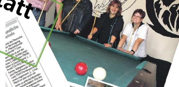
Freizeitanlage im Flecken Neuberg...

Steyerberg im Wandel: Kinder und junge Familien frühzeitig an den Ort binden und Anreize für Neubürger schaffen