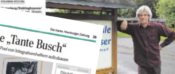
Freie Schule - Herr Schuloberrat Andreas...

Verschmelzung der konventionellen und der alternativen Grundschule angestrebt / Deblinghaus soll bleiben