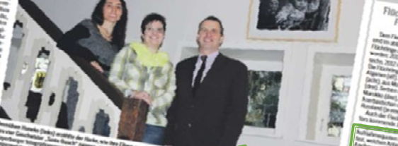
„Tante Busch“ - Integrationshelferinnen...

Harka-Serie zum Thema Asylsuchende: Steyerberg plant, einen Pool von Integrationshelfern aufzubauen