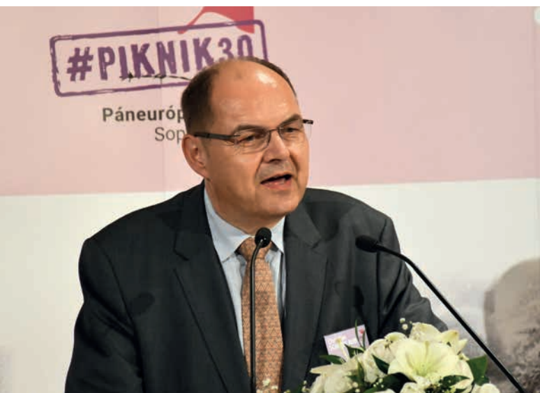
Christian Schmidt német szövetségi parlamenti képviselő, a Németországi Szövetségi Köztársaság egykori minisztere

László elmondta: „Látni kell, hogy a nyugati közvéleményben nagyon nagy bővítésellenesség van. Tehát az országok nagy többsége nem kedvezően fogadja az újabb bővítést. Így nagyon nehéz, mert Szerbia, Montenegró már elég régóta benyújtották a csatlakozási kérelmüket, el is indultak a tárgyalások. Szerbiával tizenhat tárgyalási fejezetet nyitottak meg, ebből kettőt tudtak összesen ideiglenesen lezárni. Tehát ez azt jelenti, hogy egy lassított tárgyalás van. Én azt gondolom, hogy az Unió hitelessége is ilyen szempontból fontos.” Végezetül a korábbi igazságügyi miniszter arra figyelmeztetett, hogy ha csupán a geopolitikai tényezőket vesszük figyelembe, Európának már akkor sem szabad a nyugat-balkáni országokat más nagyhatalmak érdekeinek átengedni.