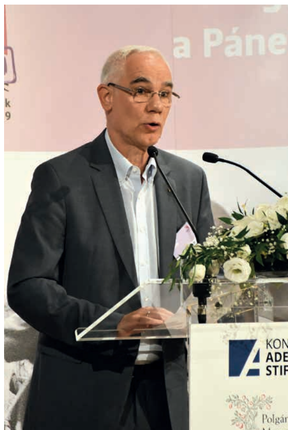
Balog Zoltán egykori miniszter

Balog Zoltán az előző két nap tanulságaként fogalmazta meg ugyanakkor egyrészt, hogy a klasszikus kelet-nyugati megkülönböztetésen túlmutató különbségtételekre van szükség Európában. Másrészt figyelmeztetett arra, hogy éppen a Páneurópai Piknik eseményeire való emlékezés során soha ne engedjük relativizálni a rendszerváltozás jelentőségét: „Az, hogy voltak 1989-ben az akkori rezsimnek olyan világosan látó és erkölcsileg is bátor politikusai, akik a szabadság oldalára álltak