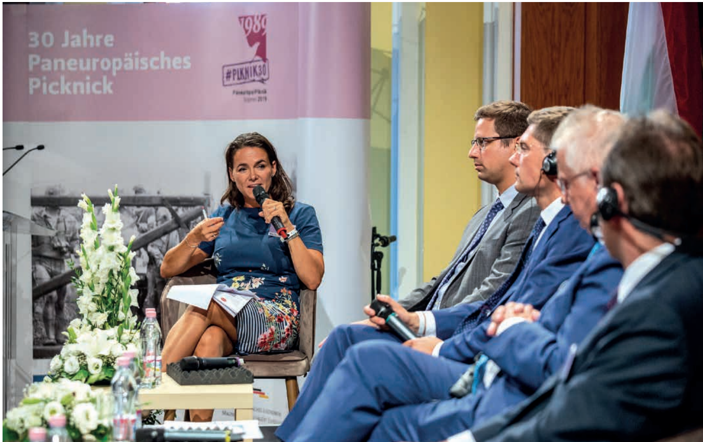
A beszélgetést Novák Katalin, család- és ifjúságügyért felelős államtitkár vezette (a képen balra).

felelős államtitkár olyan témákról kérdezte a beszélgetés résztvevőit, mint az Európai Unió további integrációja, a jogállamiság, a migráció, az Európai Unió bővítése és a klímaváltozás.