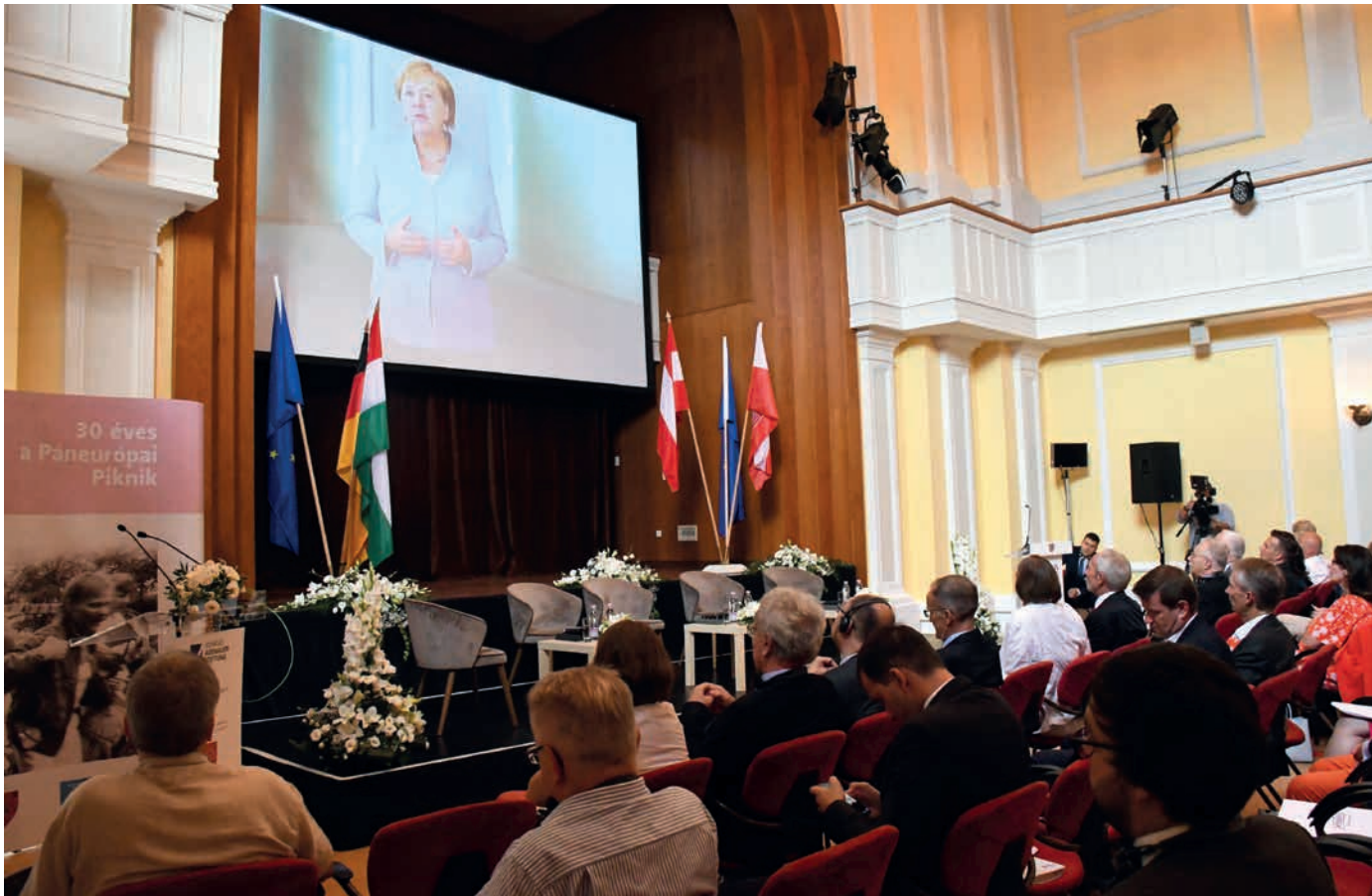
A német szövetségi kancellár videóüzenetben üdvözölte a magyarokat.

letnémetek nyaralásainak, hiszen itt lehetett találkozni az NSZK-ba kiutazott vagy oda menekült emberekkel. Magyarország akkoriban számunkra már egy darab Európa volt!" – emlékezett vissza.