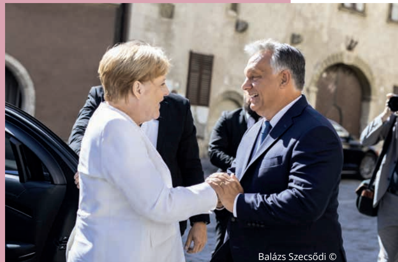
Balázs Szecsódi ©

Végezetül a német kancellár figyelmeztetett: „Európa csak annyira tud erős lenni, amennyire egységes, amennyire tehát a vitás kérdésekben is hajlandók és képesek vagyunk kompromisszumokat kötni. [...] Az európai békeprojekt nem önfenntartó, megköveteli, hogy néha átugorjunk a saját árnyékunkat. 1989 eseményei közelebb hozták egymáshoz Európa népeit. Ma szomszédokként, partnerekként és barátokként [...] közösen alakítjuk a jövőt egy egységes Európában.”