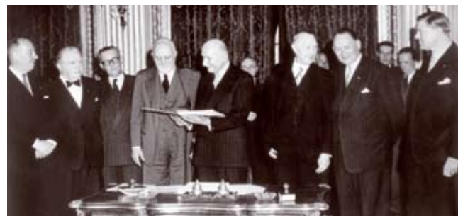
Unterzeichnung des EGKS-Vertrags am 18.4.1951 in Paris