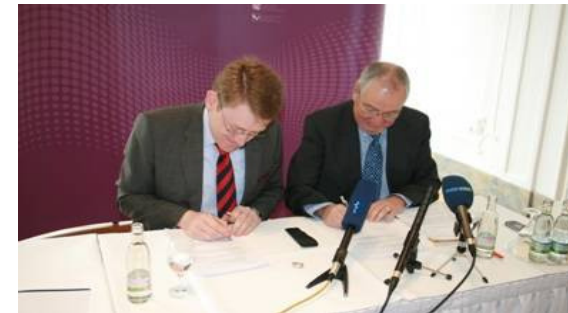
Thüringer Allgemeine vom 29.03.2011