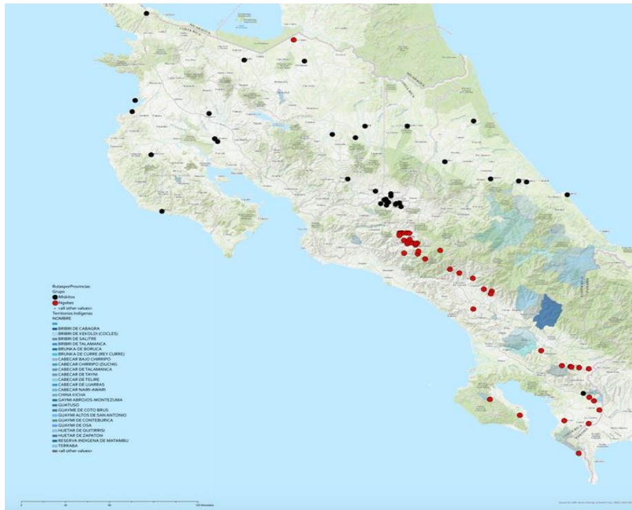
Figura 1: Mapa de Costa Rica con las rutas migratorias de las poblaciones ngäbe y miskita.