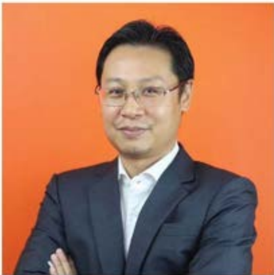
นายณัฐวุฒิ บัวประทุม รองหัวหน้าพรรคก้าวไกล ฝ่ายกฎหมาย

"ถ้าเด็กโดนกลับบ้านเยอะ ๆ ระยะยาวถ้าไม่แก้ไขอะไรเลยจะส่งผลกระทบต่อวัย เราจะมีเด็ก Generation หนึ่งซึ่งมีจำนวนพอสมควรที่ไม่ได้เติบโตอย่างเต็มศักยภาพ ในขณะที่เราต้องการกำลังคนอย่างมากในอนาคตโดยเฉพาะในภาคส่วนแรงงาน ซึ่งเราไม่จำเป็นต้องสูญเสียศักยภาพของเด็กเหล่านั้น" อ.ดร.กัญญ์ณิณีระบุ