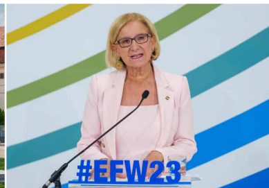
Rückblick: 27. Europa-Forum Wachau