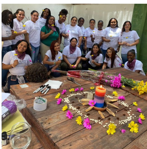
Cali, Valle del Cauca