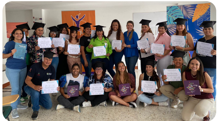
Buga, Valle del Cauca

¡Seguimos fortaleciendo redes de mujeres!