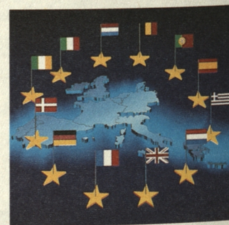
Zur wirksamen Bekämpfung der organisierten Kriminalität: „Europol“ - mit ihrem europaweiten Fahndungsnetz.

Das Europäische Kriminalamt „Europol“ und das damit verbundene europaweite Fahndungsnetz sind die Voraussetzung, um dem organisierten