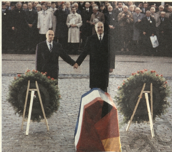
Krieg soll nie wieder möglich werden zwischen den Völkern in Europa.

Wir vergessen zu schnell, was es heißt: in Frieden leben. Auch in der Europäischen Union gibt es Probleme, aber wir lösen sie nicht mit Gewalt, sondern in friedlichen Verhandlungen.