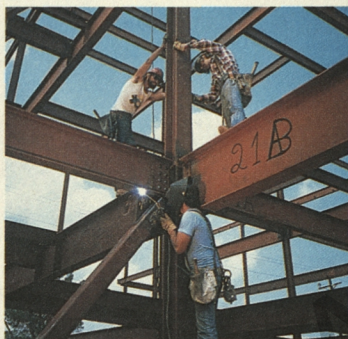
Der Wiederaufbau in den jungen Bundesländern - ohne Europa kaum denkbar.

Ein Drittel unserer Arbeitsplätze hängt vom Export ab, und mehr als die Hälfte davon vom Export in die Europäische Union. Millionen von Arbeitsplätzen sind davon abhängig, daß die europäische Einigung weitergeht.